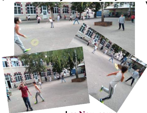
Les Nouveaux (par les CE1-CE2)